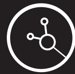
ACCESSOIRES ET CONSOMMABLES