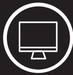
STATIONS DE TRAVAIL