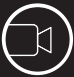
VIDÉOPROJECTEURS ET AFFICHAGE