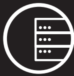
SERVEURS ET STOCKAGE