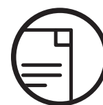
FORMATION ET SENSIBILISATION Formation personnalisée des collaborateurs