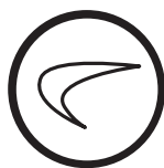
SONICWALL Firewall dernière génération, Technologie du bac à sable