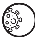
SOPHOS Solutions antivirus professionnels dans le cloud