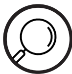
AUDITS Audit de sécurité, Audit A.D