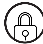
PLATEFORME DE TRANSFERT SÉCURISÉ L'équipe d'Espace Technologie a mis au point un logiciel de transfert de données chiffrées de bout en bout